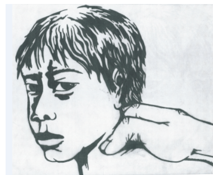
Zeichnung: Tanja Brunner

Zu bestellen bei: IG Sozialhilfe, Postfach 1566, 8032 Zürich für Fr. 28.- ig-sozialhilfe@gmx.ch